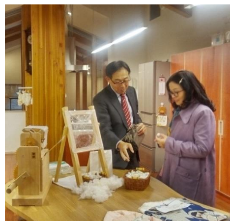
養蚕の研鑽施設をラン学長に説明