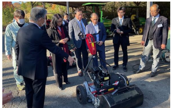
八王子 CC コース管理機材を視察

2023年12月8日(金)16:35・羽田空港発ハノイ行 VN787 便にて帰国しました。