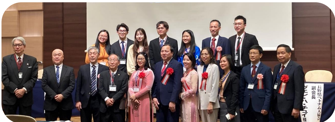
VNUA(ベトナム国立農業大学)一行と NGK(日本ゴルフ場経営者協会)とベトナム人通訳のみなさん

少子高齢化の人出不足や地方の衰退に対する再生への鍵として、外国人との共生～多文化共生が叫ばれ、転職が大きく取り上げられる中、地方と中央との格差が広がる対策として、オール長野県で「NAGANO」の良さをアピールする行政・企業・団体・市民の連携が求められます。共に、一人一人が共生を考える一つの機会としました。