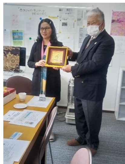
ラン学長と清水社長(名誉教授)