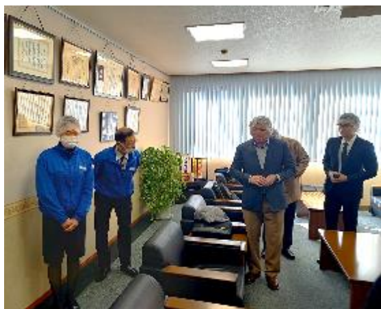
食品工場見学の毛髪落下防止の帽子装着