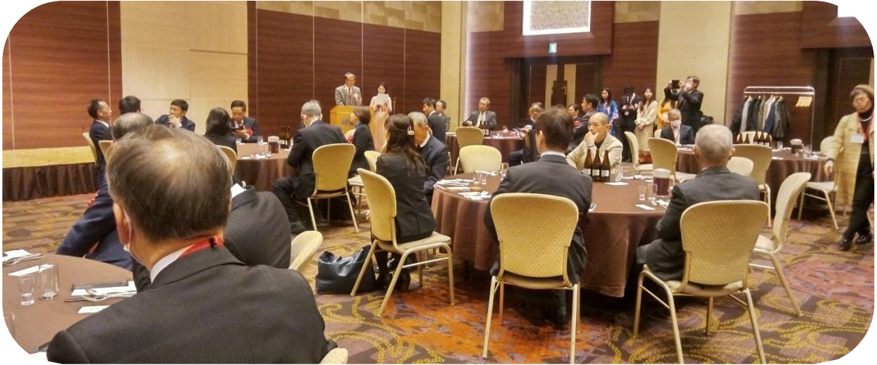
レセプション参加者の様子