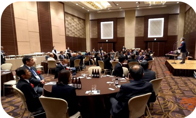
レセプション参加者の様子