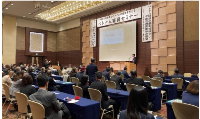
ベトナム経済セミナー in NAGANO 2023の会場の様子