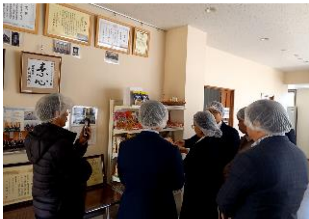
工場見学に当たっての諸注意：撮影禁止