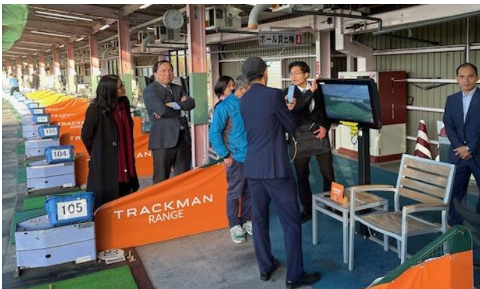
東京サマーランドゴルフ練習場、打席説明