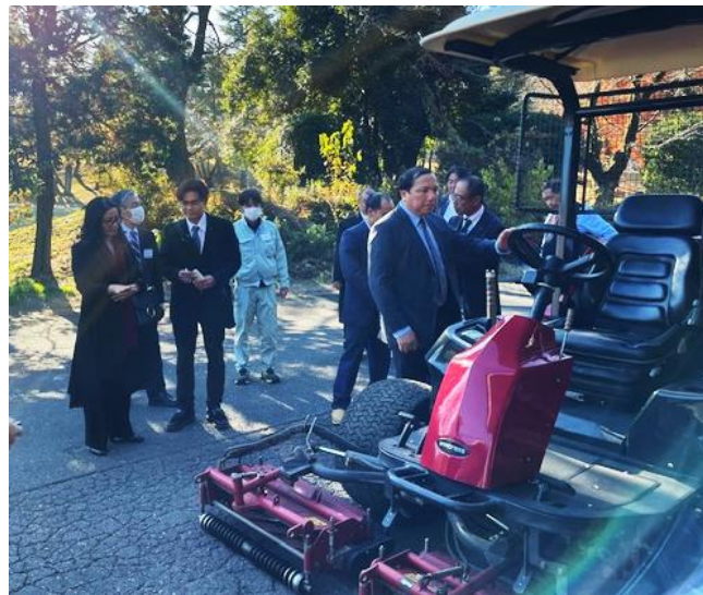
VNUA 卒業生が芝草管理に使う芝刈り機