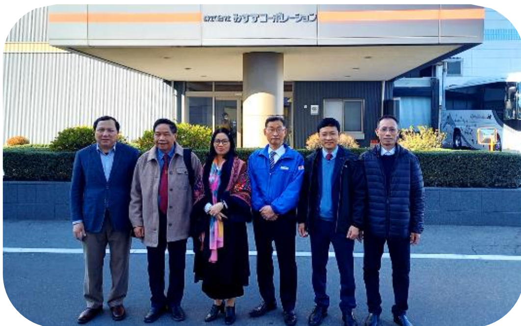
(株)みすずコーポレーション本社棟前での VNUA ベトナム国立農業大学一行