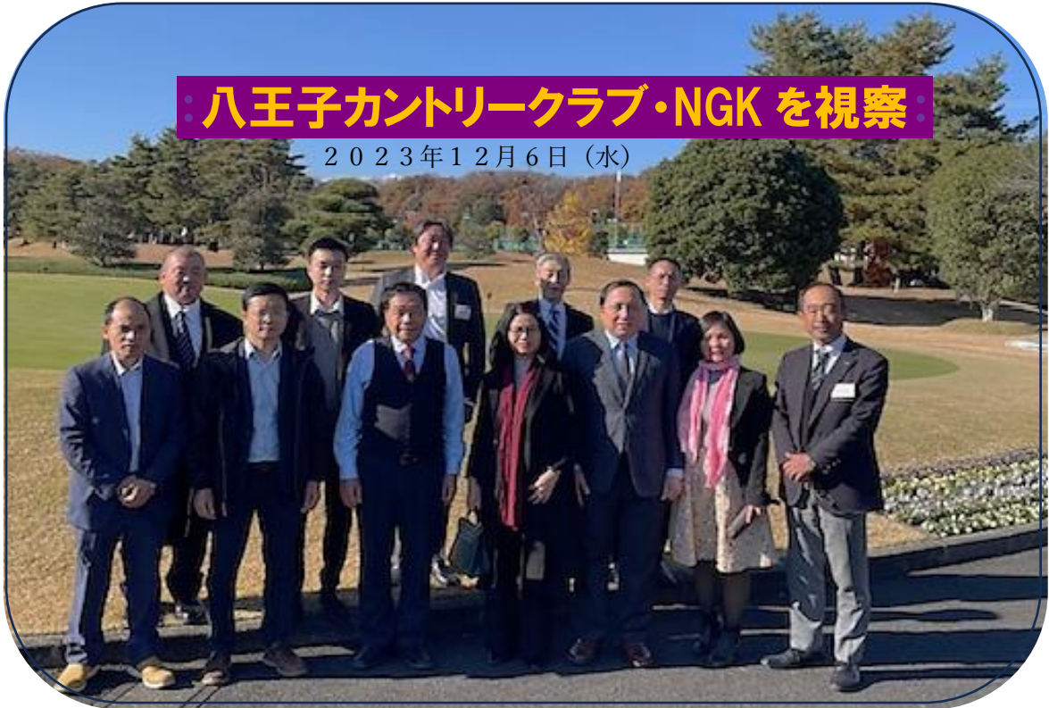
ベトナム国立農業大学ラン学長一行が卒業生の働く環境を視察に八王子カントリークラブを視察